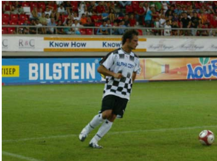
Michael Schumacher F1 Football team